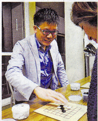
講師を務めたこんゆ二段(左)と元アマ六段