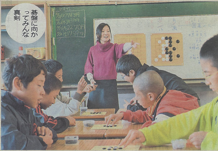
碁盤に向かってみんな真剣